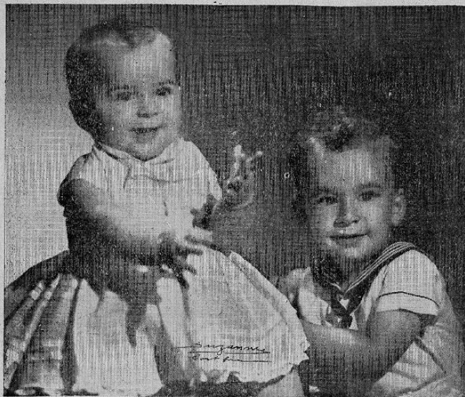
José María y Christiana Figueres Olsen, hijos del hogar del Sr. Presidente de la República don José Figueres Ferrer y su señora esposa doña Karen Olsen de Figueres, quienes celebraron su cuarto aniversario matrimonial el pasado 6 de febrero.

MUNDO FEMENINO saluda muy atentamente al estimado hogar, deseándole a los esposos Figueres y a sus preciosos hijos eterna e incontable ventura.