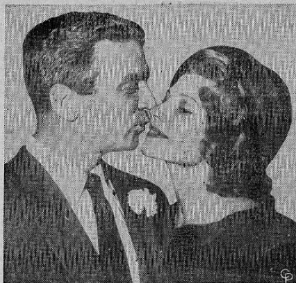
La actriz Rita Hayworth, de 39 años de edad, recibe un beso de su quinto esposo, James Hill, de 41 años, después de su matrimonio en Beverly Hills, California. Hill un solterón empedernido según sus amigos conoció a la estrella cuando ella apareció en una película que él producía. La novia llevó un vestido de crepé carmelita y raso con un sombrero que le servía de marco al rostro.