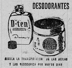
REGULA LA TRANSPIRACION DE LAS AXILAS Y LAS DESODORA POR VARIOS DIAS