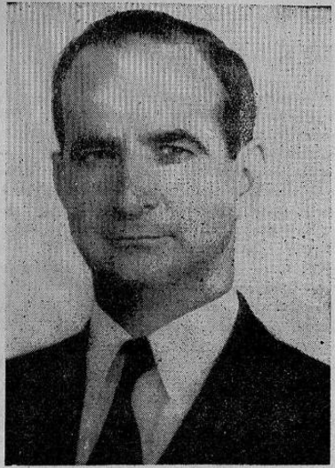
Don Pepe Figueres

El país entero ha elogiado la democrática actitud del Sr. Presidente Figueres en las pasadas elecciones, demostrando, no sólo al país sino el mundo entero que Costa Rica continúa a la vanguardia de los países en donde el derecho al libre sufragio se respeta tanto o más que la vida de sus ciudadanos.