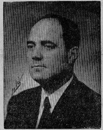
LIC. MARIO ECHANDI

son el protocolo a la Convención Interamericana sobre derechos y deberes de los Estados en el caso de luchas civiles y la Convención Interamericana sobre la concesión de los derechos políticos a la mujer. Haití es el tercer país que ha ratificado el protocolo y la duodécima nación que ha ratificado la Convención. El protocolo pone al día la Convención original y vigente. Pasa a la Pág. TRES